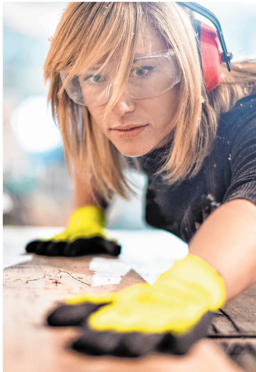
Immer mehr Jüngere bekommen nur befristete Jobs: Die SPD will die sachgrundlose Befristung abschaffen, um den Menschen Perspektiven und Planbarkeit zu ermöglichen.

Die SPD wird Geld in die Hand nehmen, damit es nach vorne geht. Unter den Industrieländern hat Deutschland eine der niedrigsten